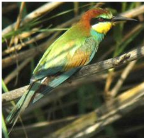
Bijeneter Anders Hammergart

Waterhoen Gallinula chloropus . Agia Meer 1 28/4. Meerkoet Fulica atra . Kournas meer 27/4, Agia Meer div 28/4, Reservoir Chersonissos 1 met jongen 6/5. Oeverloper Actitis hypoleucos . Kournas meer 1 27/4. Geelpootmeeuw Larus michahellis . Vrijwel overal in havens langs de noordkust, stuwmeren en open water. Stadsduif Columba livia forma domesticus . Diverse Heraklion 24/5. Houtduif Columba palumbus . Alleen in afgelegen beboste gebieden, Samaria kloof enkele 28/4, voor reservoir Apostoli div 7 en 8/5. Turkse Tortel Streptopelia decaocto . Overal in bebouwd gebied. Zomertortel Streptopelia turtur . Imbros 1 27/4, Reservoir Chersonissos 1 6/5, Lassithi plateau div 6/5, voor reservoir Apostoli 2 7 en 8/5. Koekeek Cuculus canorus . Hotel Areti 1 24/4, Imbros 1 27/4, Samaria kloof 1 28/4. Dwergooruil Otus scops . Iedere avond rond hotel Areti 2, hotel Idi 1, Knossos ruines 1 2/5. Gierzwaluw Apus apus . Diverse Heraklion 24/5. Vale Gierzwaluw Apus pallidus . Tussen Kefalos en Platani div 30/4.