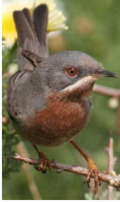
Baardgrasmus Colin & Sue Turvey