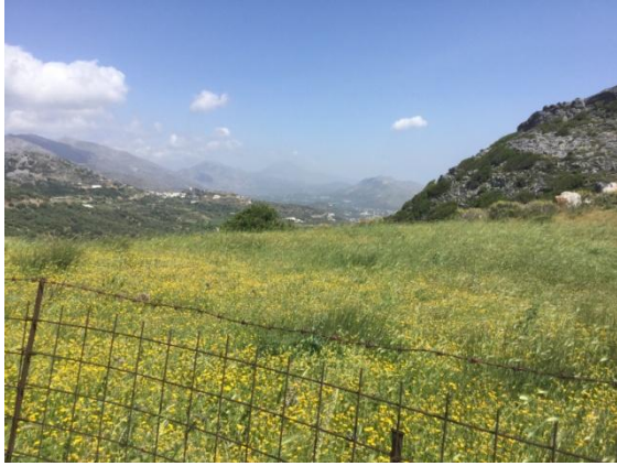
Bloemenzee, vlak langs de kant van de weg