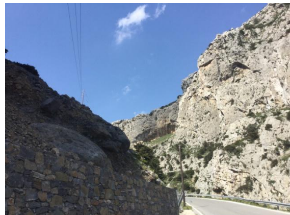
Kloof, met op het diepste deel de autoweg

Wat opvalt, is dat je maar weinig vogels te zien krijgt; ze zijn erg schuw. Er is al heel lang op ze gejaagd en ook nu gebeurt dat nog. BirdLife International (2017) stelt dat in het Middellandse Zeegebied 25 miljoen vogels illegaal worden gedood als lekkernij, voor de verkoop, sport of de jacht. Op de ergste 20 plaatsen als Cyprus en Malta zijn dat naar schatting 8 miljoen vogels. Het gaat op Kreta alleen om minder vogels, voornamelijk omdat er geen grote moerassen met veel watervogels voorkomen. Sommige soorten worden erdoor in hun voortbestaan bedreigd. Overal vind je kapotgeschoten verkeersborden. Ook in de woeste gebieden is het heel lastig een kleine zangvogel in beeld te krijgen. Je moet het dan ook van je gehoor hebben en voor de determinatie is vooral kennis van de roepjes van belang. Heel vaak wordt er niet gezongen.