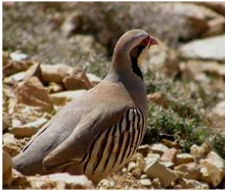
Chukar of Aziatische Steenpatrijs Nikos Samaritakis

Waterhoen Gallinula chloropus . Agia Meer 1 28/4. Meerkoet Fulica atra . Kournas meer 27/4, Agia Meer div 28/4, Reservoir Chersonissos 1 met jongen 6/5. Oeverloper Actitis hypoleucos . Kournas meer 1 27/4. Geelpootmeeuw Larus michahellis . Vrijwel overal in havens langs de noordkust, stuwmeren en open water. Stadsduif Columba livia forma domesticus . Diverse Heraklion 24/5. Houtduif Columba palumbus . Alleen in afgelegen beboste gebieden, Samaria kloof enkele 28/4, voor reservoir Apostoli div 7 en 8/5. Turkse Tortel Streptopelia decaocto . Overal in bebouwd gebied. Zomertortel Streptopelia turtur . Imbros 1 27/4, Reservoir Chersonissos 1 6/5, Lassithi plateau div 6/5, voor reservoir Apostoli 2 7 en 8/5. Koekeek Cuculus canorus . Hotel Areti 1 24/4, Imbros 1 27/4, Samaria kloof 1 28/4. Dwergooruil Otus scops . Iedere avond rond hotel Areti 2, hotel Idi 1, Knossos ruines 1 2/5. Gierzwaluw Apus apus . Diverse Heraklion 24/5. Vale Gierzwaluw Apus pallidus . Tussen Kefalos en Platani div 30/4.