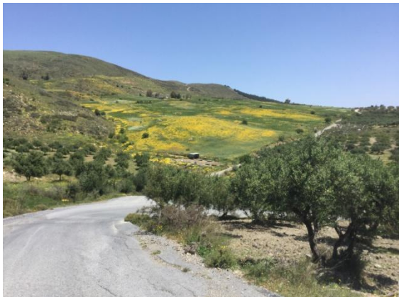
Rustige binnenweg in agrarisch gebied

Alle niet steile hellingen en vlakke gebieden zijn volledig in beslag genomen door de landbouw, behalve het winderige en woeste Granvousa schiereiland. Als het ook maar even kan zijn er olijfbomen aangeplant. Soms zijn daar prachtige exemplaren tussen met een stamdoorsnede van circa één meter en vol met natuurlijke holtes. Elders heeft de vooruitgang toegeslagen en zijn jonge, laagblijvende olijfbomen aangeplant.