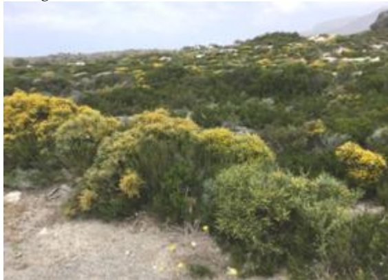
Lage, bloeiende maquis