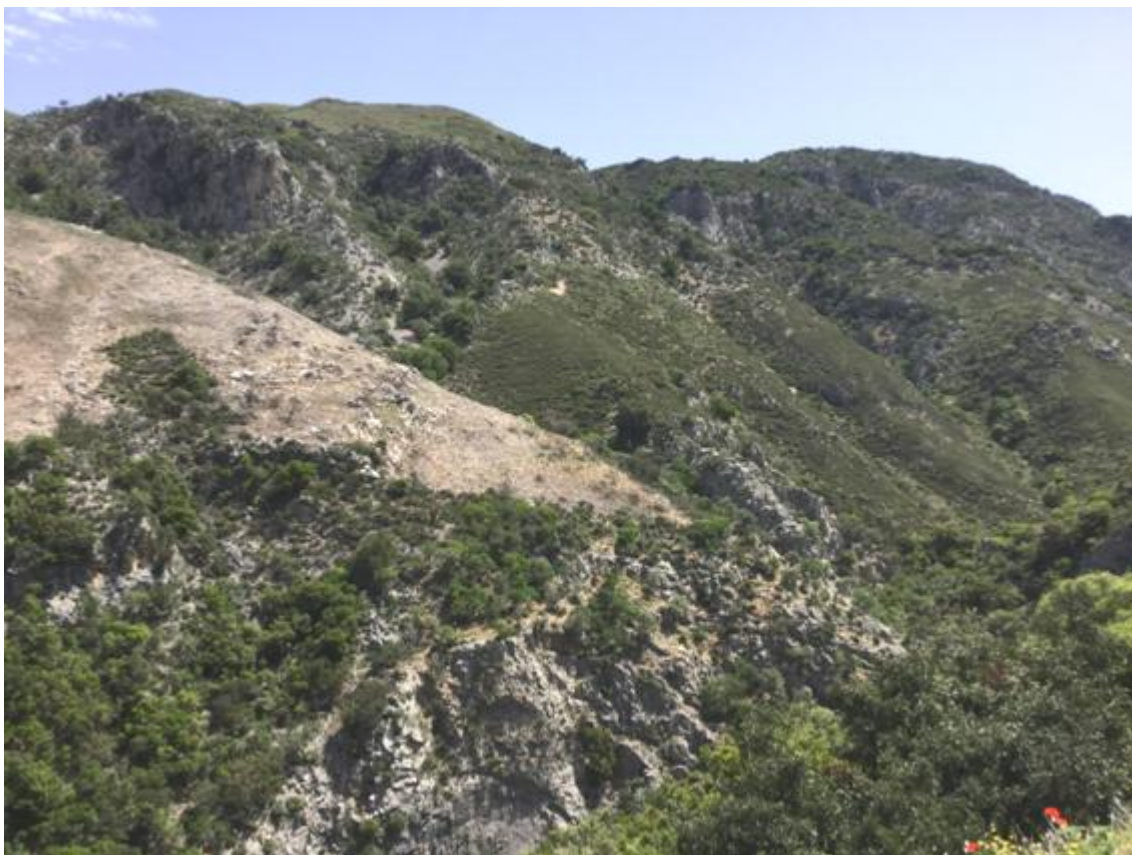
Kreta, woest berglandschap.