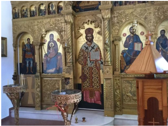
Rijkversierde kapel in het binnenland

ti. Binnen zijn fresco's aangebracht, staan beelden en veel andere rijk versierde religieuze voorwerpen. Kennelijk wordt er niet gestolen; werkelijk een verademing.