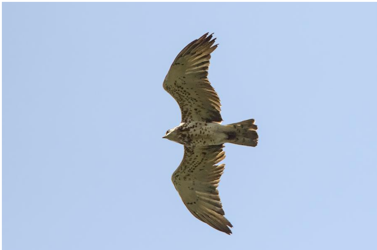
Slangenarend, HES van Schoonhoven, 20 juli 2017