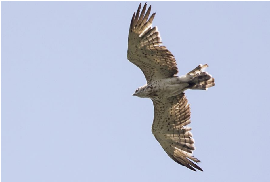
Slangenarend, duidelijk een andere vogel. HES van Schoonhoven, 20 juli 2017