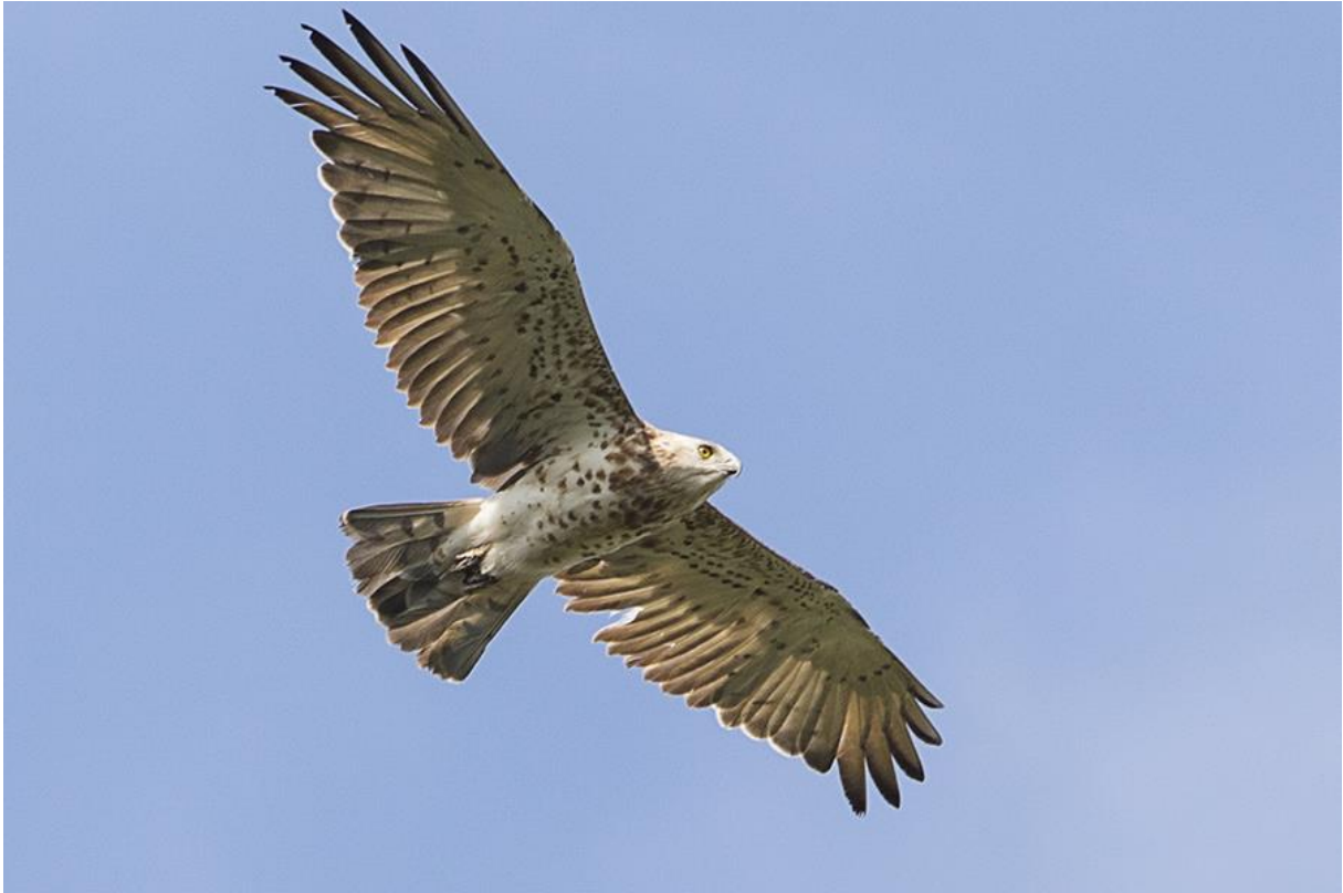
Slangenarend, HES van Schoonhoven, 19 juli 2017.