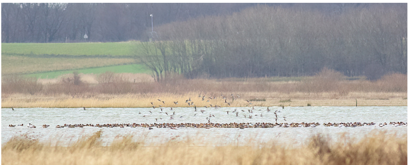
Bonte Strandlopers en groep Wintertalingen met Kokmeeuwen, Pijlstaarten, Smienten en Slobbeenden bij hoogwatervluchtplaats (HVP) voor de Duintjes.