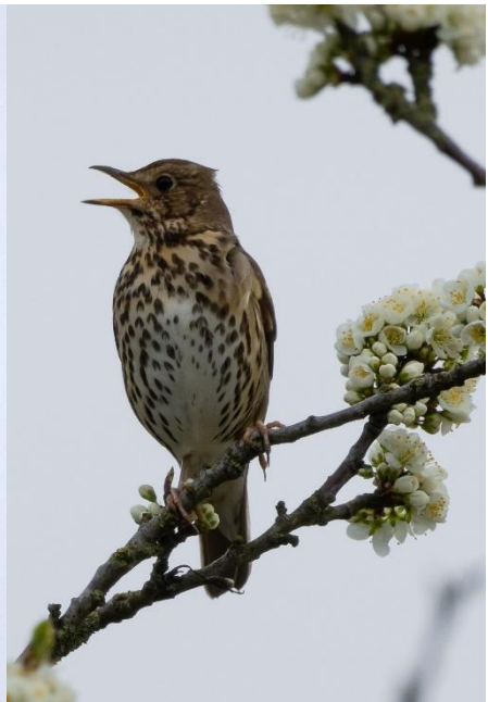
Ijsvogel, Zanglijster en Zwartkop.