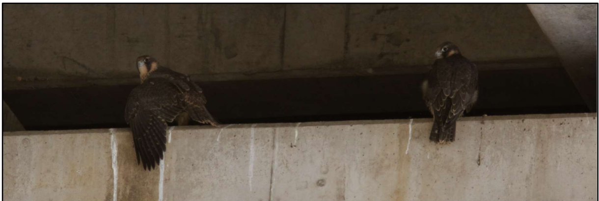
2 van de 3 waargenomen jongen van Brienoordbrug, 18 juni 2023

De Brienoordbrug , Rotterdam, is niet echt een nieuwe locatie want de laatste 2 jaar belandde er elke keer een pas-uitgevlogen jong in de problemen. Ze werden, nauwelijks (vliegvlug) gevonden op de grond of het fietspad en waren een overduidelijk bewijs dat er een geslaagde broedpoging was geweest. Dit jaar is de locatie van het nest “ongeveer” gevonden en zijn er minimaal 3 jongen gezien.