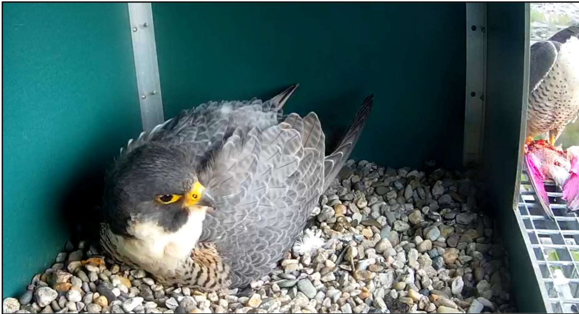
Duivenhouders verven hun duiven om roofvogels af te schrikken. Alphen aan de Rijn, 26 april 2023.