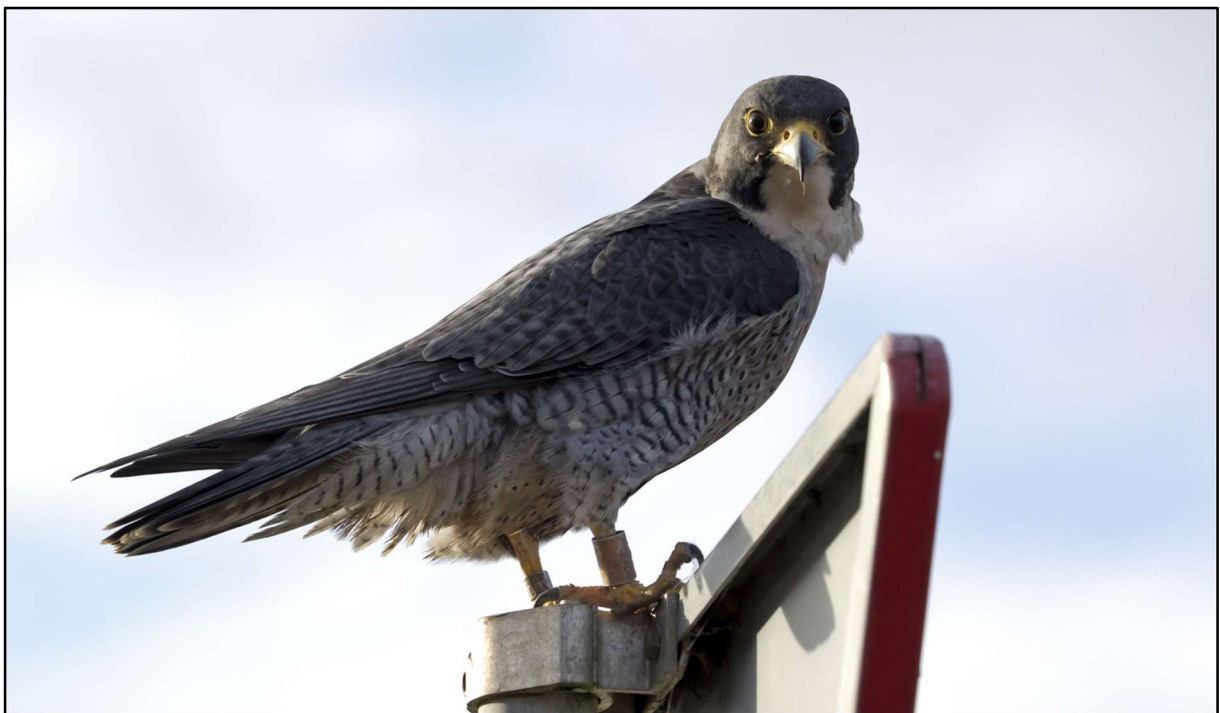
Rotterdammer XF in Serooskerke, Zeeland. 14 januari 2024.

XF is van een broedgeval op de HEF in Rotterdam in 2011. Het jong kwam via het parkje bij de HEF terecht in de vogelklas en werd op 8-7-2011 weer losgelaten op het dak van het Unilever gebouw. Serooskerke, dus! 12 jaar en 6 maanden na het loslaten, en 52Km verderop.