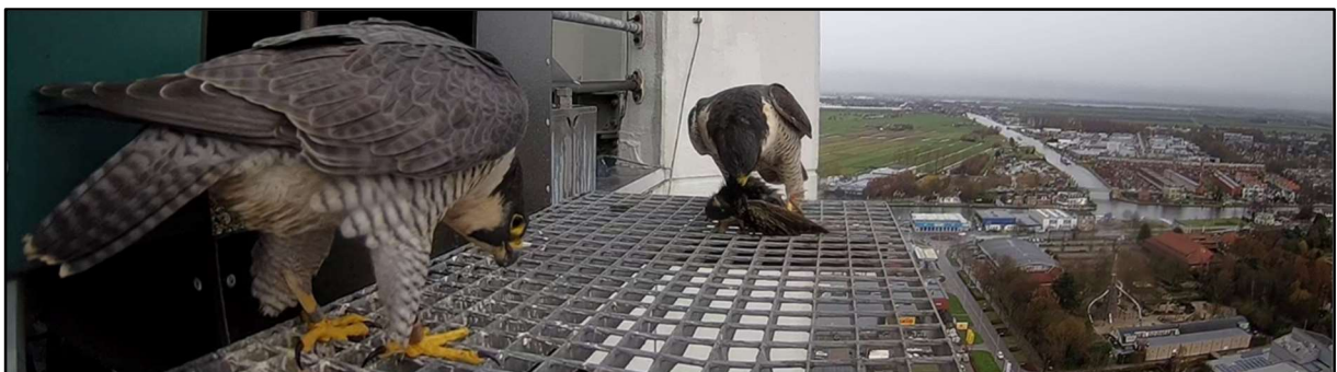
Mannetje bied vrouw een spreek aan, Alphen a/d Rijn.