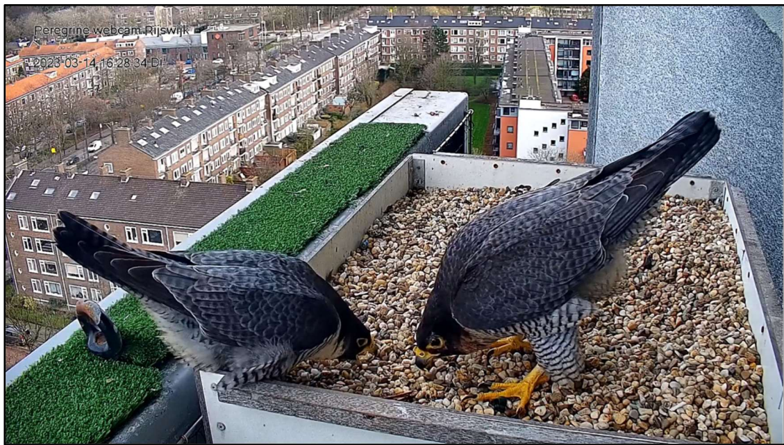
Het koppel in Rijswijk date wel, maar deed nog niet aan gezinsuitbreiding Rijswijk, 14 maart 2023.