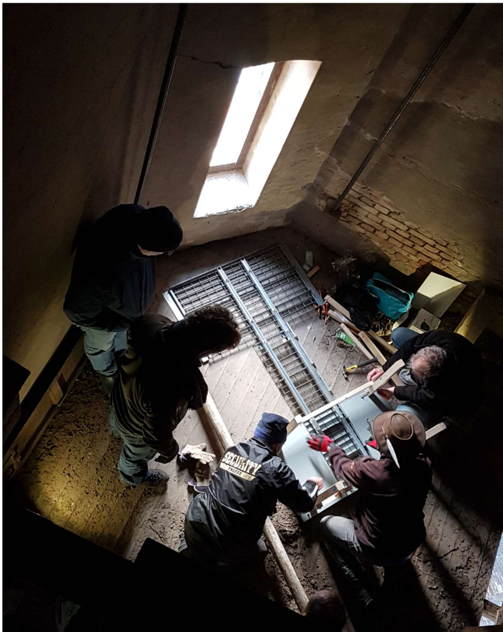
Plaatsen slechtvalknestkast, Sassenheim, 19 november 2022