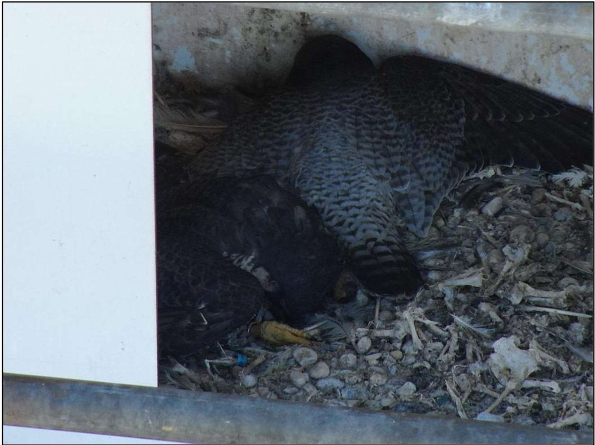
Een drone inspectie toont 2 dode valken, Geertruidenberg, 3 maart 2023

In Alphen NB , succesvol met 4 jongen, werden plukresten van wielewaal gevonden, voor ons de eerste keer dat we deze prooisoot tegenkwamen.